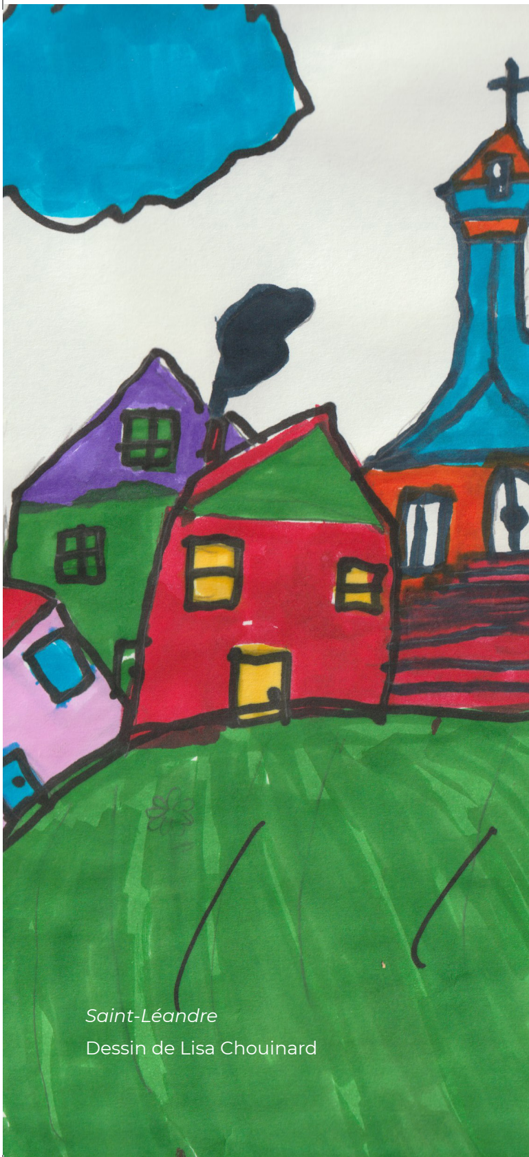
Saint-Léandre Dessin de Lisa Chouinard